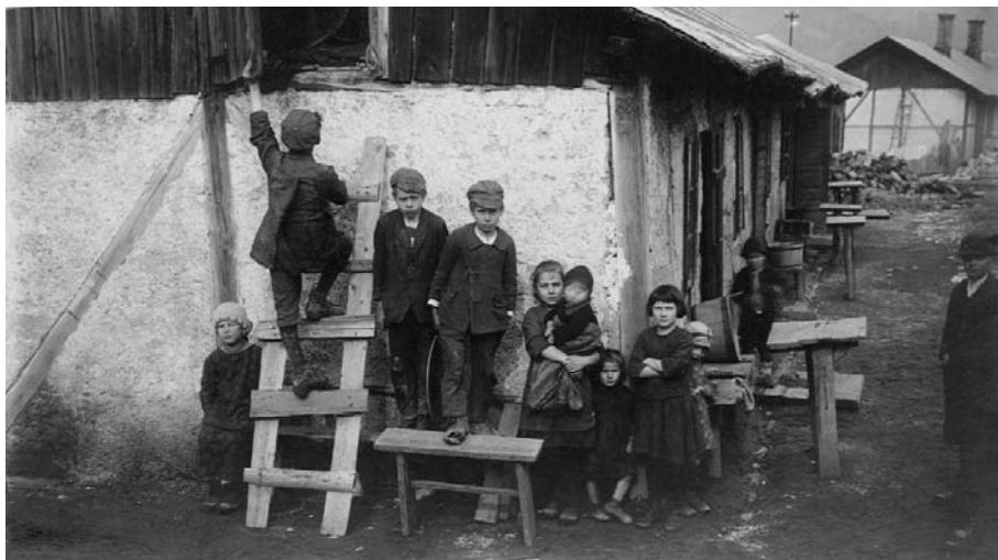
Slika 2: Otroci v koloniji Dobrna, 20. leta 20. stoletja, fototeka ZMT.

Glede na velikost delavskih stanovanj pa ne preseneča, da se je večina življenja družin, zlasti pa otrok, odvijala na dvorišču. Tako tudi opravljanje domačih opravil, ki so jih otrokom »naložile« matere: »čiščenje šuhov, ribanje ganka in šteng, odnašanje smeti, praznjenje kahle, prinašanje vode od štirne, ...,« 38 Vsa dela so morali opraviti, preden so se »potepli po hauzih« in okolici.