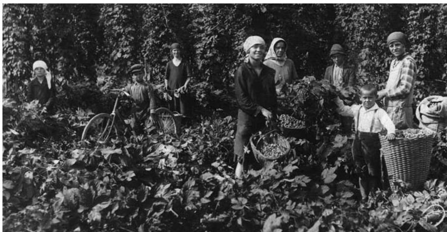
Slika 1: Zasavske žene so skupaj z otroki hodile v »tabrh«, v Prekopi – pri Vrnskem leta 1937