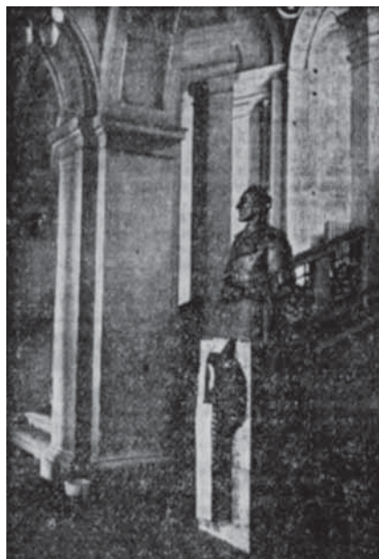
Slika 4: Spomenik kralju Aleksandru v univerzitetni avli.

Fig. 4: The memorial commemorating King Alexander in the lobby of the university building.