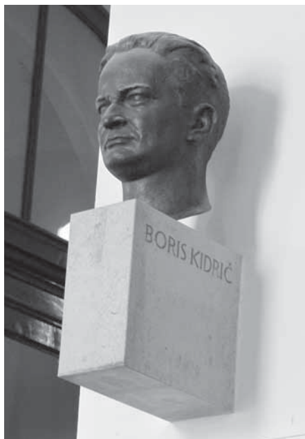
Slika 6: Kip Borisa Kidriča.

Avtor kipov je akademski kipar Boris Kalin (na vratu obeh kipov je vrezana njegova signatura B. KALIN ), ki je v svojem obsežnem opusu spomeniške plastike izdelal tudi vrsto slovenskih spomenikov narodnoosvobodilnemu boju. Oba revolucionarja, ki ju je izdelal za univerzo, je upodobil večkrat. Že leta 1957 je izdelal celopostavno Tomšičevo figuro, ki je bila postavljena pred istoimensko ljubljansko osnovno šolo ob Zemljemerski ulici, odlitka Tomšičevega doprsnega kipa z univerze pa sta (bila) na ogled še v nekdanji šentviški vojašnici in velenjskem muzeju.