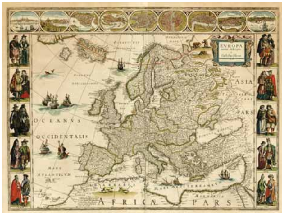
Slika 5. Willem Janszoon Blaeu, Evropa recens descripta (Blaeu 1635). Grški par, ki nosi turban in hidžab, je v spodnjem desnem kotu.

Zanimivi viri za zgodnjenovoveške stereotipe so bili tudi zemljevidi z upodobitvami različnih ljudstev, kot je znameniti dekorativni zemljevid Evropa recens descripta (»Nedavno opisana Evropa«) iz leta 1617 in različne poznejše reprodukcije (sl. 5). Zasnoval ga je Willem Janszoon Blaeu (1571–1638), ugledni nizozemski geograf,