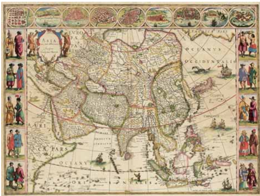
Slika 6. Willem Janszoon Blaeu, Asia noviter delineata (Blaeu 1635). Ruski par nosi krznena oblačila in krznene kape ali kučme na desni strani, drugi od spodaj navzgor.

Namenoma sem vključil Blaeujev zemljevid Evrope, ker je pomembno prikazati, da občasno sploh ne najdemo stereotipnih ali kakršnihkoli predstav o Rusih in Turkih v evropskem okviru. Razumeti je treba, da sta bili z evropske perspektive Rusija in Turčija še vedno obrobni. Drug znamenit primer takšne odsotnosti so »Oblačila različnih narodov« ( Variarum Gentium Ornatus ) Sebastiana Vrancxa in Pietra de Jodeja iz začetka 17. stoletja, ki ne vključuje niti Rusov niti Turkov. 63 Na Blaeujevem zemljevidu Evrope ni bilo Rusov ali Turkov, toda grški par je nosil turban in na vrhu zemljevida je bil Konstantinopol. Tako predvidevam, da bi grški par predstavljal »evropske Turke«, podobno kot poznejši štajerski Völkertafel , kjer sta bila upodobljena skupaj. To zблиževanje in razhajanje Grkov in Turkov je zanimiv