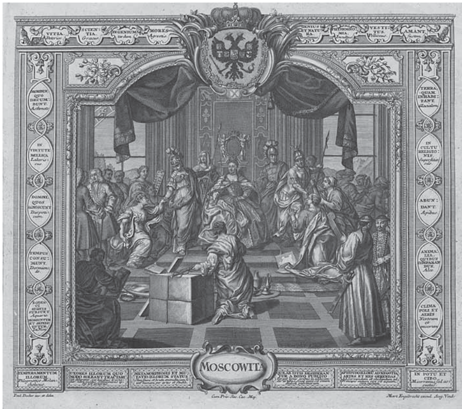
Slika 3. Tisk za Ruse, Laconicum Europae Speculum (Engelbrecht 1730, nepaginirano).