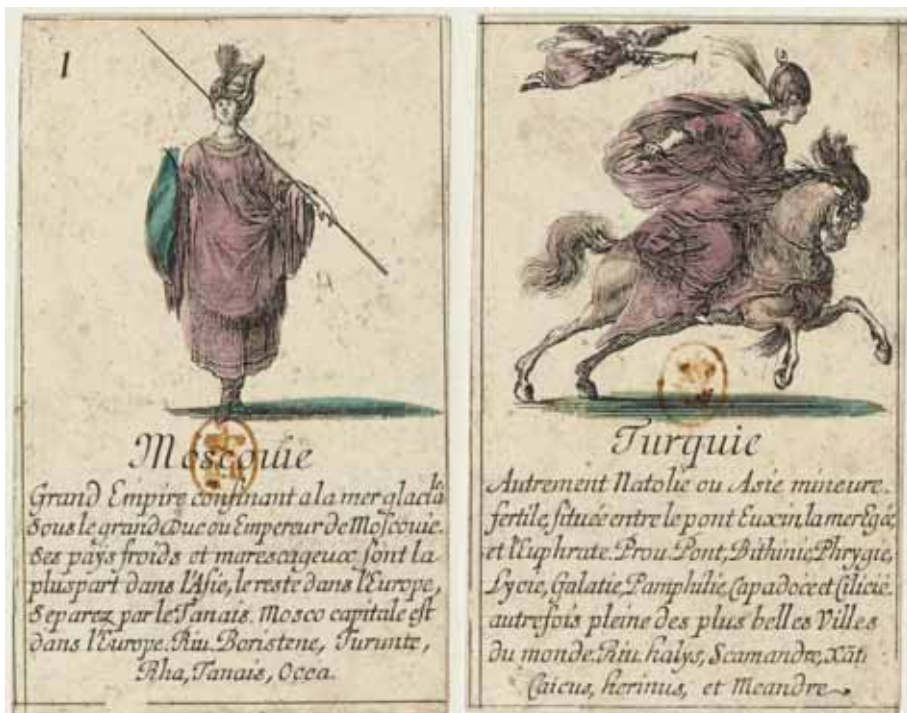
Slika 4. Igralna karta za Rusijo in Turčijo (Desmarets, Bella 1644).

Komplet kart Geographie je bil sestavljen iz 52 kart v štirih barvah, kot pri vsakem običajnem paketu kart danes. 60 Toda namesto src, karov, pikov in križev je bila vsaki barvi dodeljena celina, to so Evropa, Afrika, Azija in Amerika. V vsaki barvi je kralj ali R(oi) poosebljal celino (upodobljene so bile dejansko ženske figure, kot je bilo običajno za celine), medtem ko so bile karte od asa preko fanta ali VA(let) in kraljice ali D(ame) predstavljene kot ženske podobe držav. Karte, ki so predstavljale dvorne figure ( Valet, Dame, Roi ), so bile na konju ali na bolj eksotičnih živalih, npr. Amerika je bila na ogromnih pasavcih, Azija pa na slonih. Vsaka karta države je imela kratko besedilo, ki je opisalo zastopano državo ali celino, vedno na način, ki je izdal takratne stereotipe. Evropo so na primer opisali