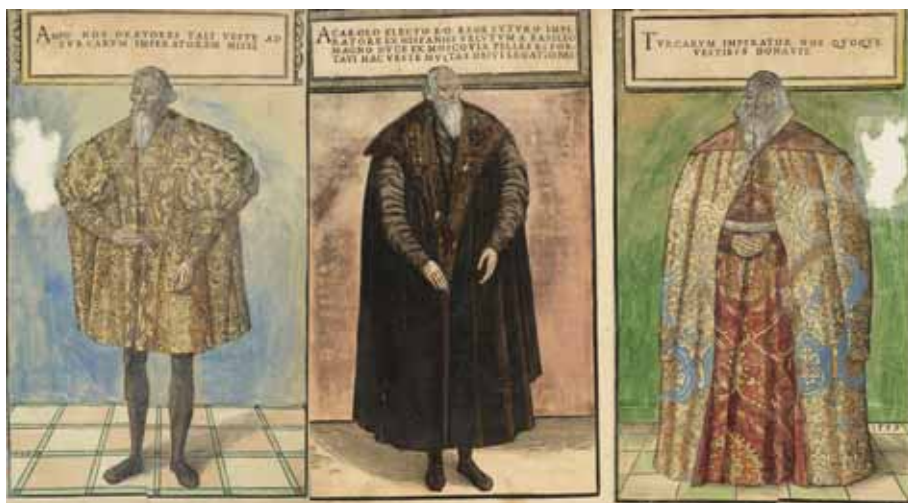
Slika 8. Sigismund Herberstein v častnih oblačilih, ki so mu jih podarili habsburški cesar, ruski veliki knez in turški sultan (Herberstein 1560, nepaginirano).