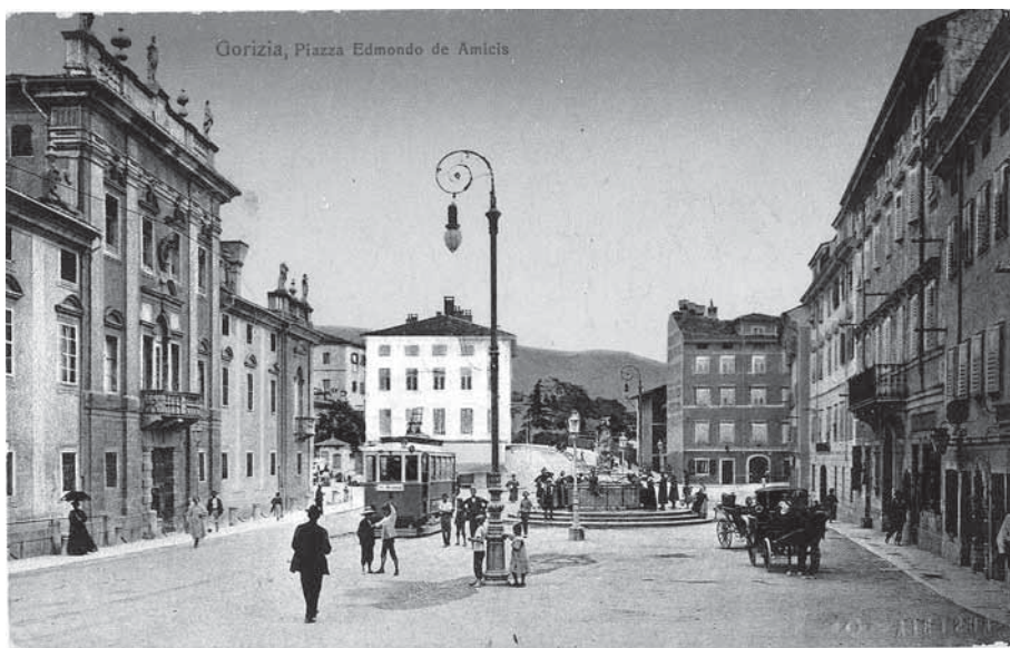
Slika 2: Središče Gorice pred prvo svetovno vojno