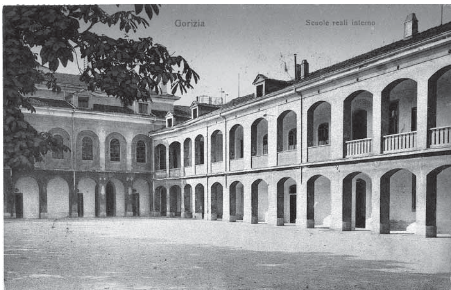
Slika 1: C. kr. višja realka v Gorici, kjer so se izobraževali tudi številni slovenski dijaki