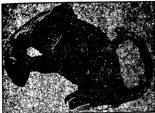
Most na Soči, bronzasta miš iz rimskodobne stavbe