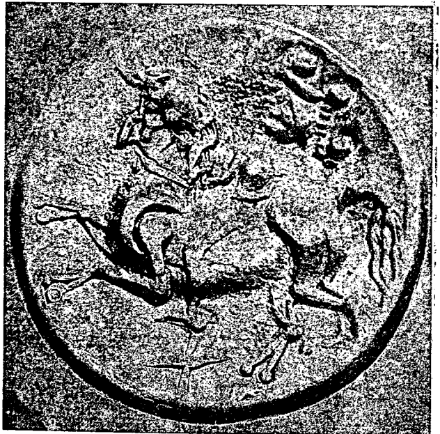
Most na Soči, keltski srebrnik, sreda 1. stol. pr. n. št.