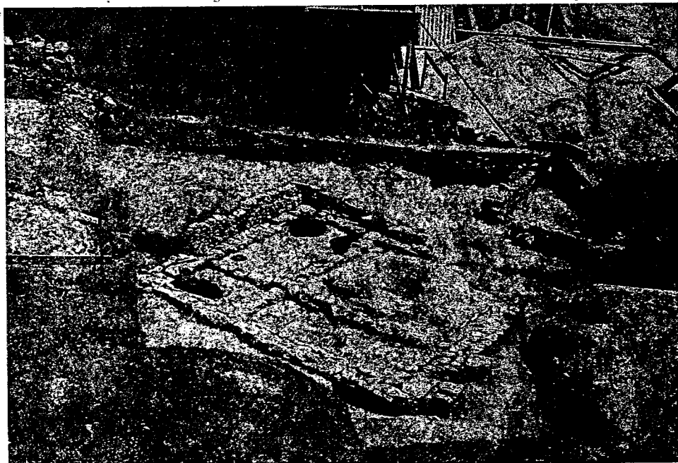
Most na Soči, železnodobna hiša

Starejša obdobja tolminske prazgodovine so, slabše raziskana, tudi najdišč je manj; prav verjetno ta gorati in z dolinami prepreženi svet ob Soči in njenih pritokih ni bil vselej za bivanje in preživljanje primeren. Paleolitski lovci so imeli svojo postajo in taborišče na lovskih in nabiralniških pohodih v jami Divje babe pri Šebreljah, danes visoko nad strugo Idrijce (od leta 1980 dalje jo raziskuje Inštitut za arheologijo ZRC SAZU), ki je bila tudi pribežališče in brlog jamskega medveda v srednjem in mlajšem paleolitu (datirana med 70.000 in 35.000 pred sedanjostjo). 3